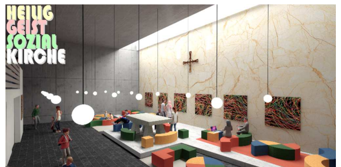
Mögliche Ansichten der „Sozialkirche Heilig Geist“ (Arbeitstitel)

Katholische Kirchengemeinde St. Marien Oberhausen www.marober.de info@marober.de