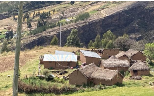
In den Comunidades gibt es kaum Veränderungen. Die Menschen hier leben von Subsistenzwirtschaft. Viele, vor allem die Jüngeren, ziehen in die Großstädte Boliviens.