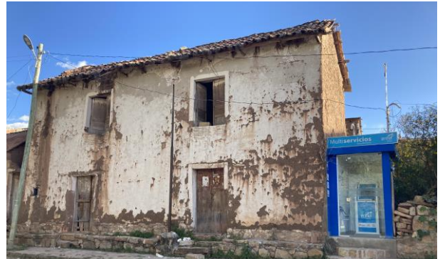
Neue Technik neben alten Häusern: In den Hauptorten in Norte Potosí gibt es mittlerweile an einigen Stellen Internetzugänge