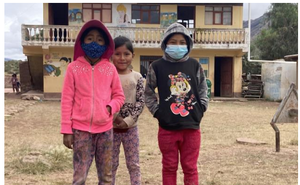
Die Covid-Infektionszahlen sind in Bolivien zurzeit niedrig. In den Schulen gilt Maskenpflicht. Impfungen stehen kostenlos zur Verfügung.

Zurzeit gibt es weitere Fotos unseres Besuchs unter www.facebook.com/mefnortepotosi