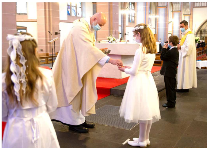
Erstkommunion 2021 in der Marienkirche