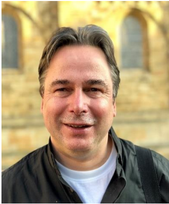
Kreuzdarstellung in der St. Ludgerikirche Münster

Angefertigt 1929 vom Bildhauer Heinrich Bäumer. Bei einem Bombenangriff 1944 schwer in Mitleidenschaft gezogen. Am Ende des Krieges wurde von der Gemeinde beschlossen, dieses Bildnis unseres Glaubens ohne Arme und Hände zu belassen.