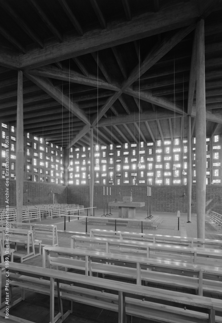
Foto: Artur Pfau, ca. 1959, Quelle: Historisches Archiv des Erzbistums Köln

Kirche Heilige Familie (HEFA) Zeichnung, Fotografie, Modell Zugänge zur Architektur der ‚Tafelkirche‘