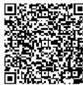
QR- Code Christlich leben.

Nehmen Sie bei Fragen und Ideen gerne unter projektteam.oberhausen@bistum-essen.de Kontakt mit dem Projektteam auf. Wir freuen uns auf Ihre Nachricht!